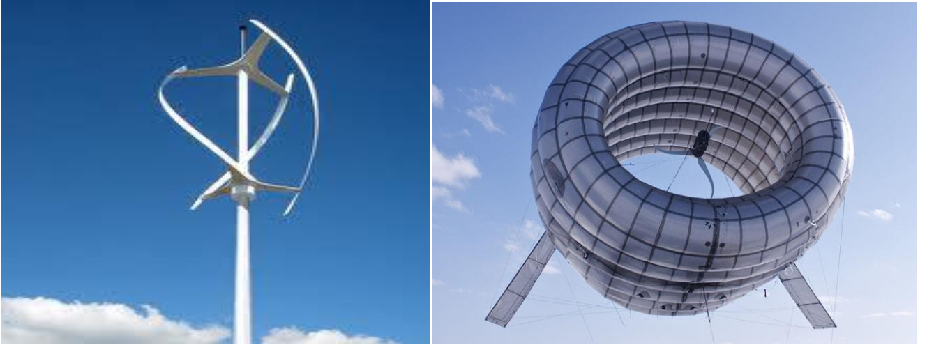
Şekil 2. YYYY