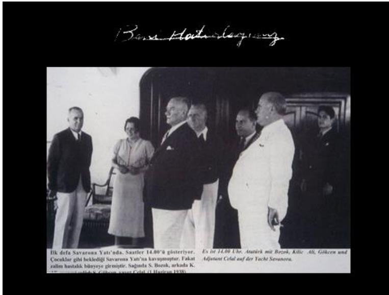
Atatürk'ün Savarona'da ilk günü. 1 Haziran 1938