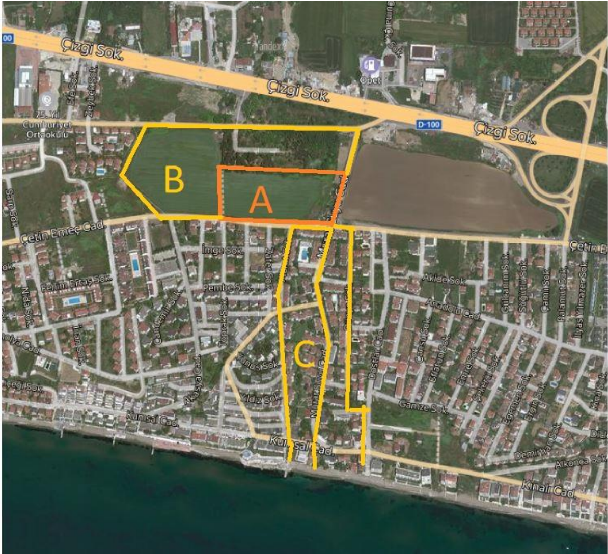
Çalışma alanı: Silivri Yaklaşık: 25.000 m 2

Bu bilgiler doğrultusunda verilen çalışma alanında birincil konut olarak kullanılabilir potansiyeli olan alanlarda esnek ve sürdürülebilir tasarım bağlamında değerlendirilmesi beklenmektedir. Haritada A harfi ihtiyaç programında istenenlerin gerçekleştirileceği alanı, B harfi kentsel toplanma alanı ve rekreatif etkinliklere olanak veren alanı, C harfi çalışma için röper noktası olacak ve bağ kurulması beklenen Yasemin Evleri Sitesi'ni göstermektedir.