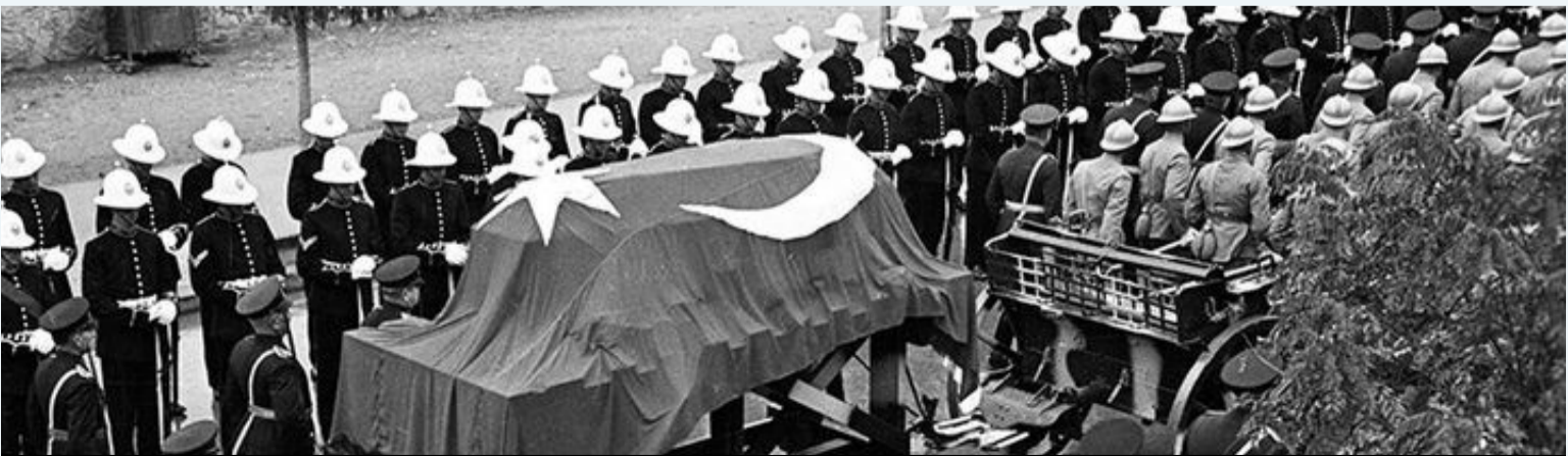
Artık görev sona ermiştir. 19 Kasım 1938; cenaze İstanbul'dan ayrılmak üzere.