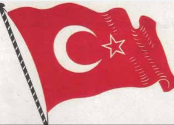
Savrona'da Hatay'ın bayrağını çiziyor.