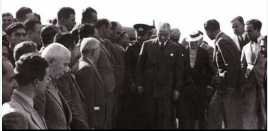
20.05.1938 günü Hatay ile ilgili görüşmeler yapmak ve Fransa'ya mesaj vermek için Mersin'de.