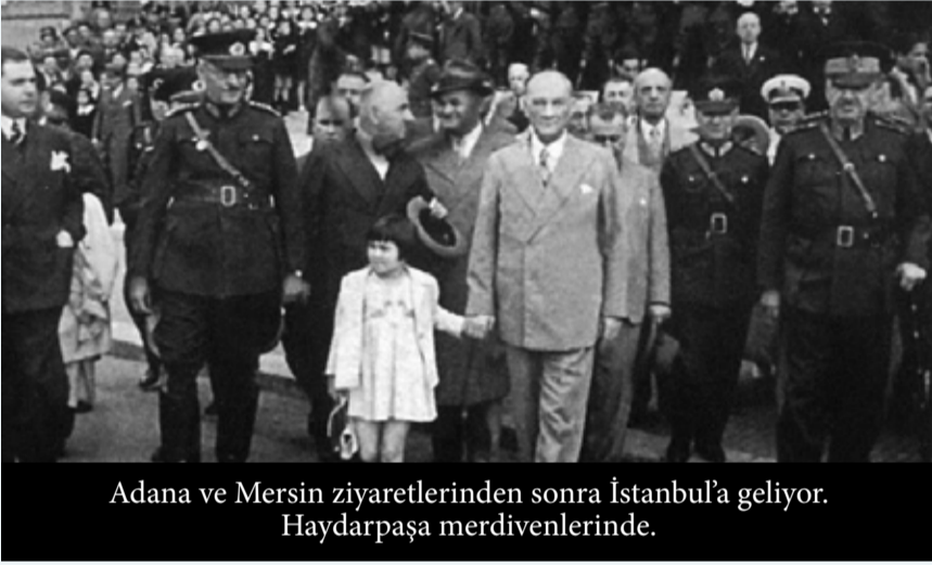
Adana ve Mersin ziyaretlerinden sonra İstanbul'a geliyor. Haydarpaşa merdivenlerinde.