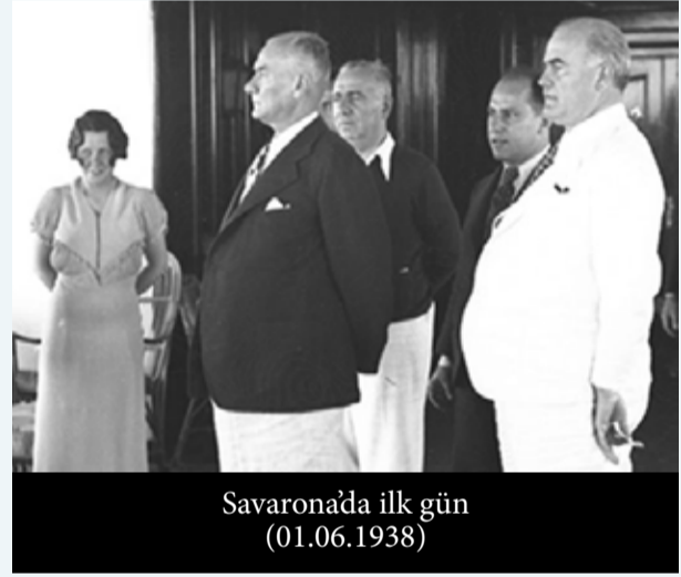
Savrona'da ilk gün (01.06.1938)