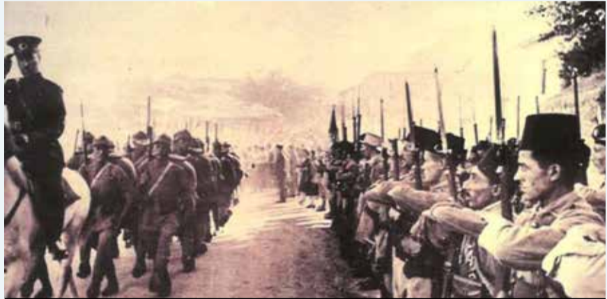
İzlediği yoğun dış politika sonucu Fransa, Türk Ordusu'nun Hatay'a girişini onaylamak zorunda kalıyor.