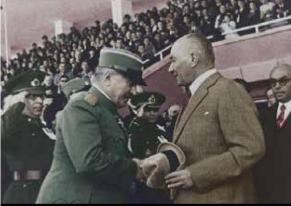
Atatürk 19 Mayıs törenlerinden ayrılırken Yugoslav Savaş Bakanı Mariçe veda ediyor.