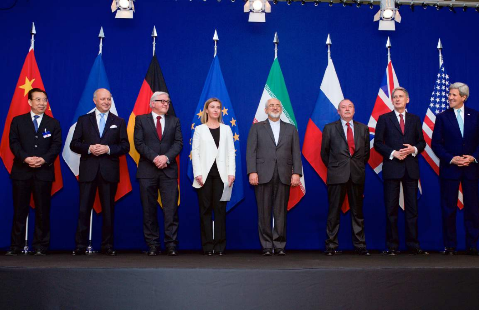
İran ve P5+1 ülkeleri

Amerika Birleşik Devletleri (ABD) Başkanı Donald Trump'ın, 8 Mayıs 2018 tarihinde kısaca İran Nükleer Anlaşması olarak adlandırılan Kapsamlı Ortak Eylem Planı (JCPOA)'nı çekileceği açıklamasının gerek küresel ve bölgesel gerek kısa ve uzun vadeli yansımaları gözlemlenmektedir. Trump'ın selefi Obama'nın kurumsal ve çok taraflı diplomasisinin öncülüğü ile P5+1 (Almanya) ülkelerinin İran ile üzerinde mutabakat vardığı anlaşma, uzun müzakereler sonucu elde edilen kazanımların bir ürünüdür. Bu nedenle ki, Trump'ın anlaşmadan geri çekilmesinin uluslararası hukuk, diplomasi, silahsızlanma, enerji piyasaları ve Transatlantik ilişkilerini de doğrudan etkilemesi gibi bölgesel-küresel dinamikler açısından etki alanı bulunmaktadır. Bu analizde; Trump'ın anlaşmadan çekilmesindeki gerekçeler, çekilmenin gerek ABD iç hukuku gerekse uluslararası hukuk açısından değerlendirilmesi, ABD-Avrupa Birliği (AB) hattında nasıl bir kırılmaya sebep olduğu ve AB-İran ilişkileri açısından sonuçları irdelenmektedir.